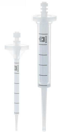
Table de précision (pointes DD tips // de BRAND, 20 °C 'Ex')